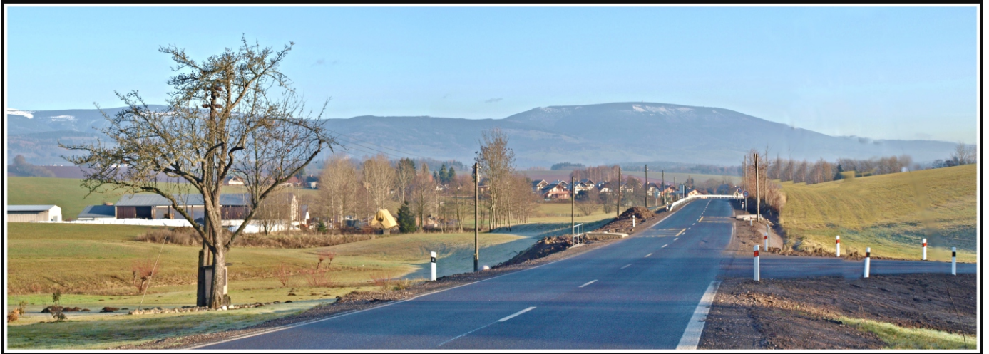
Opravená silnice