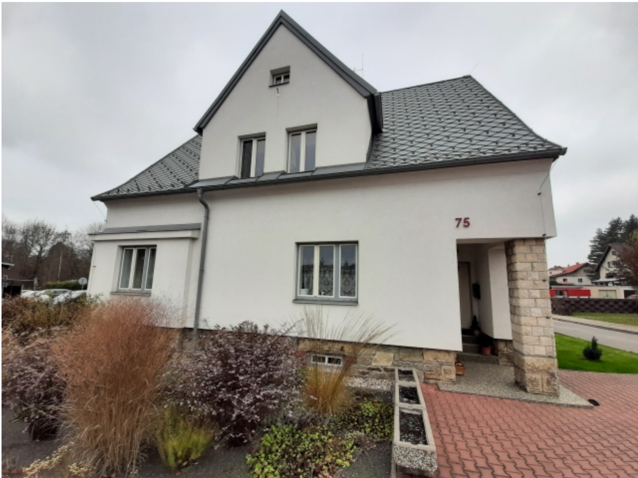
4. Požární zbrojnice - pravá strana