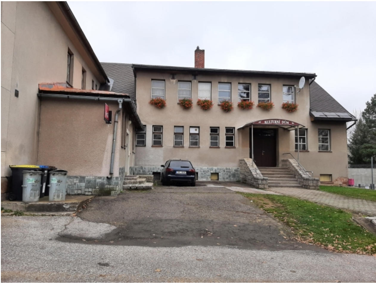
3. Kulturní dům - přední strana 1