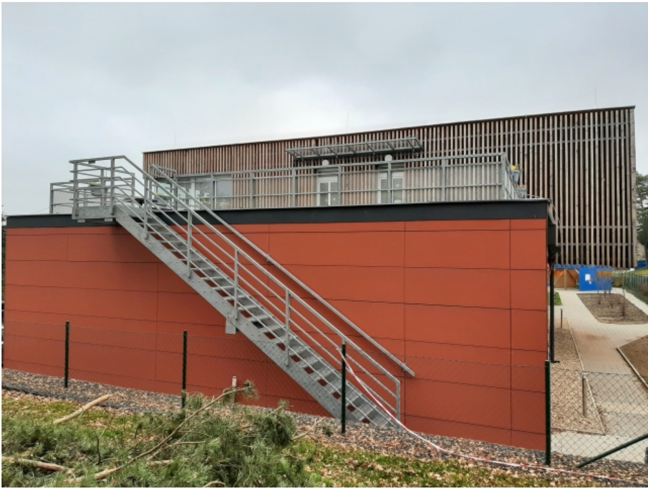
2. Základní a mateřská škola - zadní strana 1