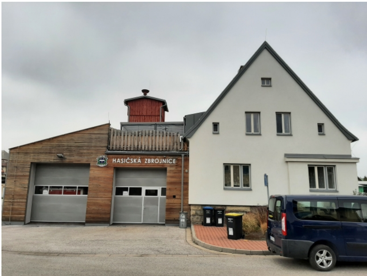
4. Požární zbrojnice - přední strana