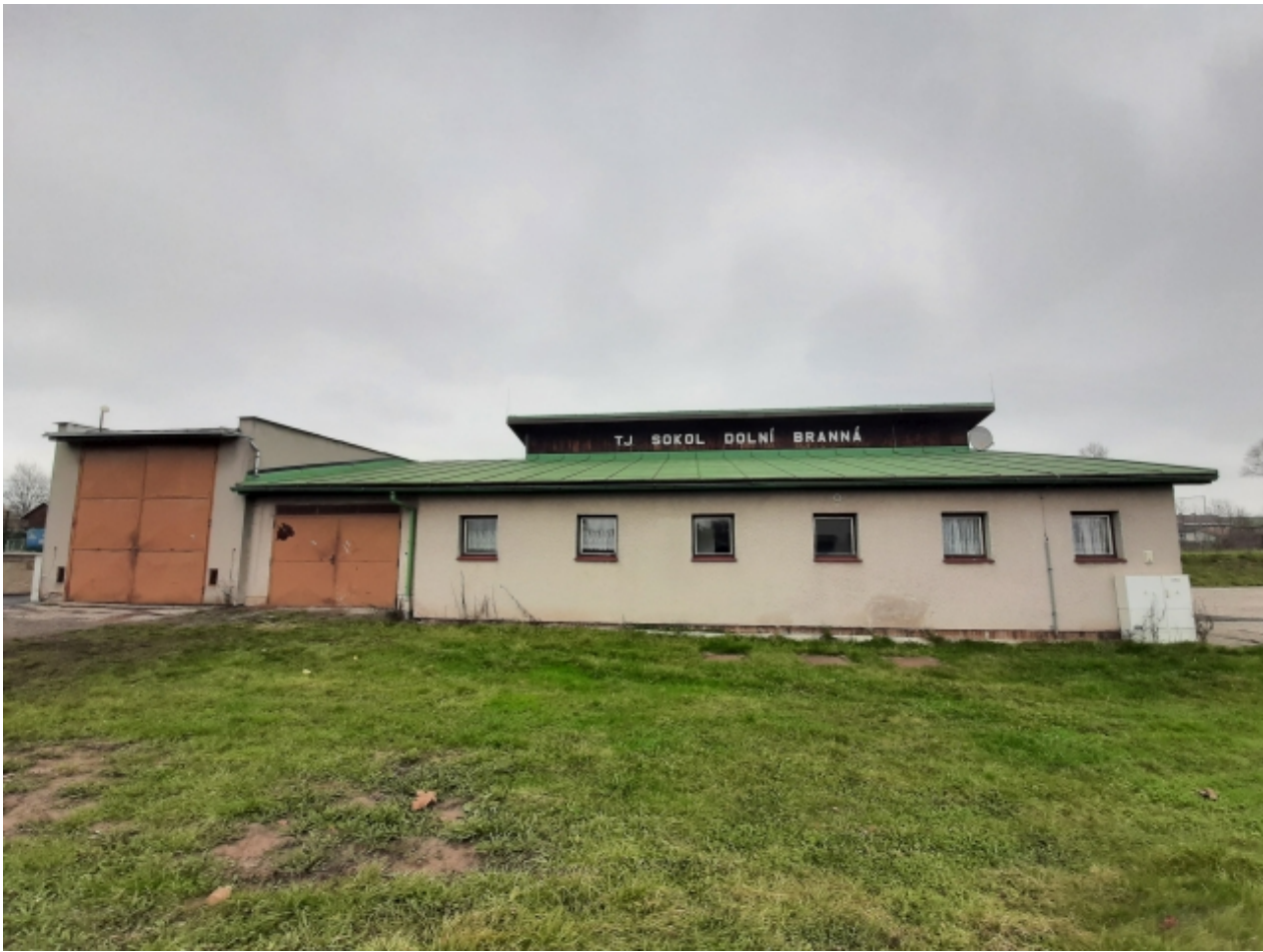
6. Kabiny TJ Sokol - zadní strana