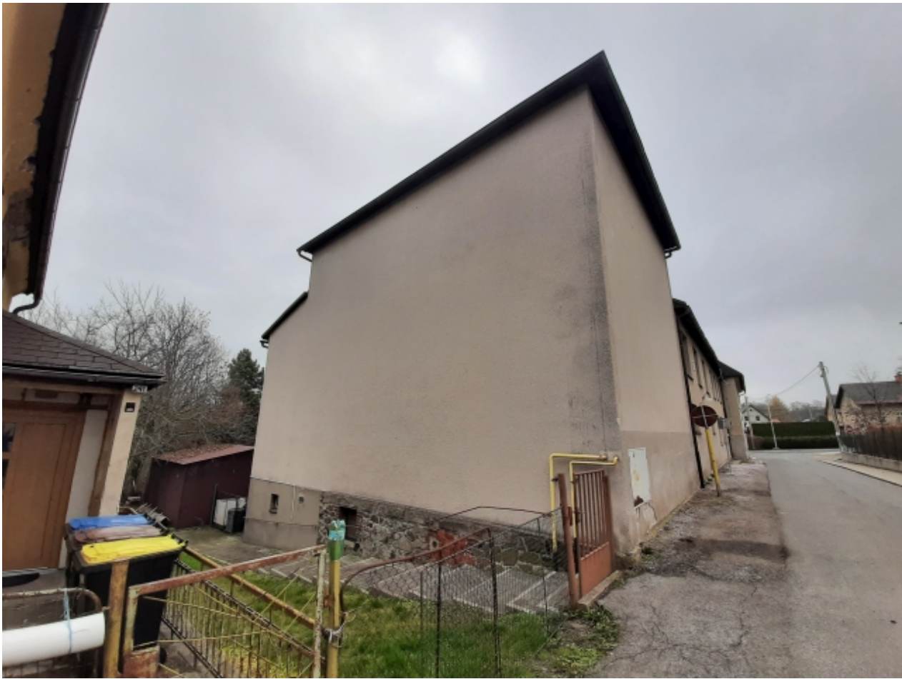
3. Kulturní dům - zadní strana