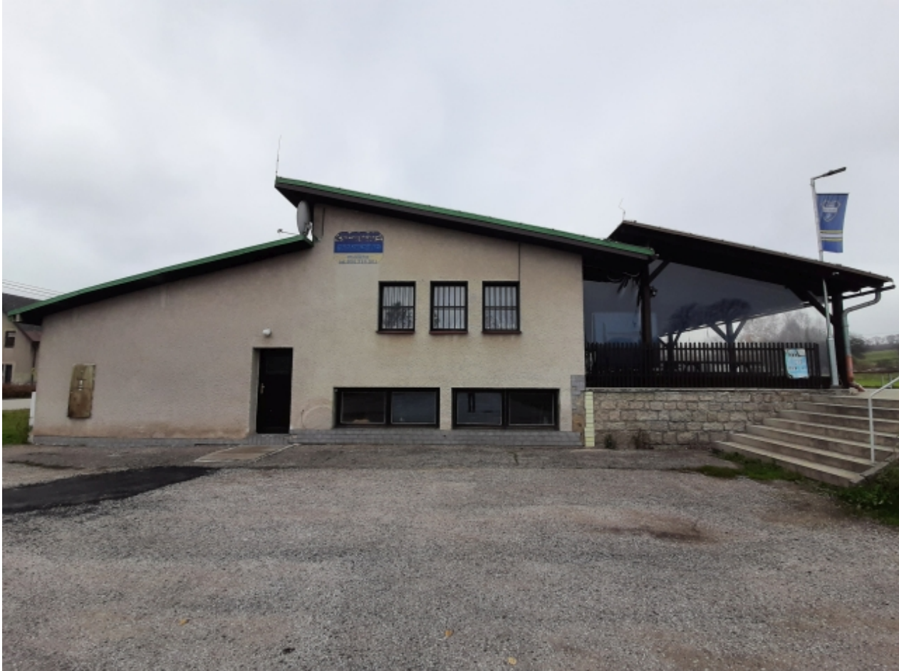
6. Kabiny TJ Sokol - levá strana