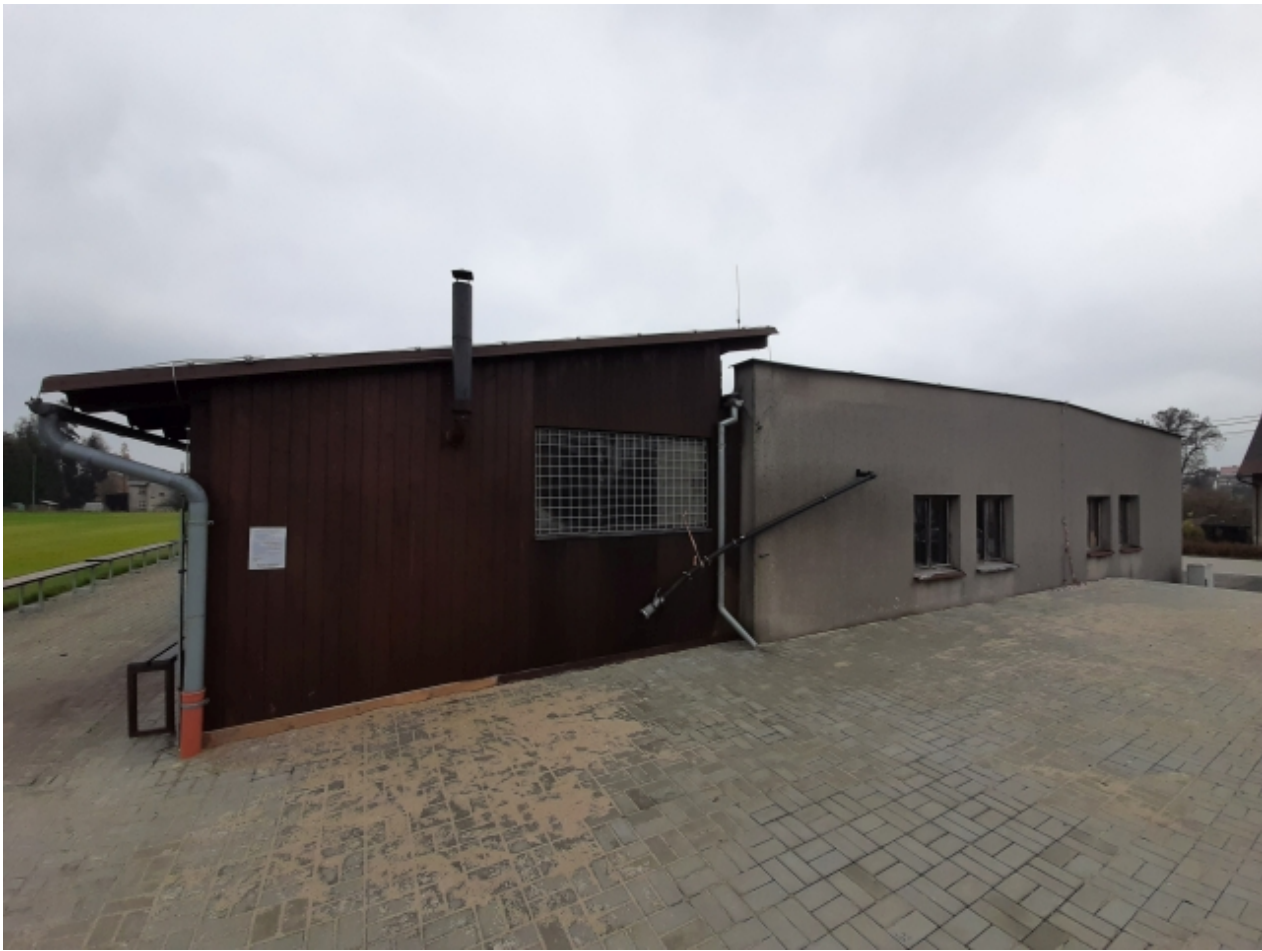
6. Kabiny TJ Sokol - pravá strana 1