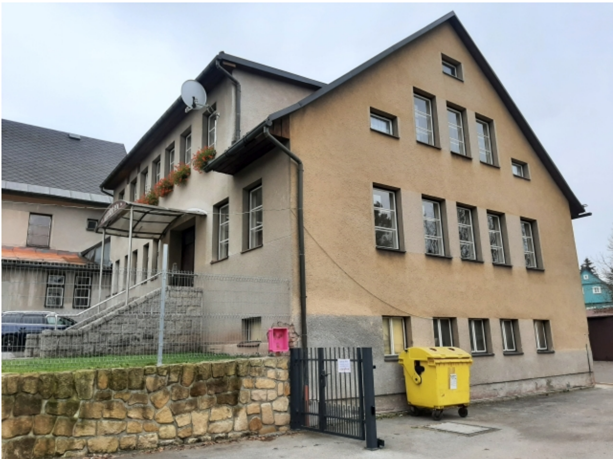
3. Kulturní dům - pravá strana