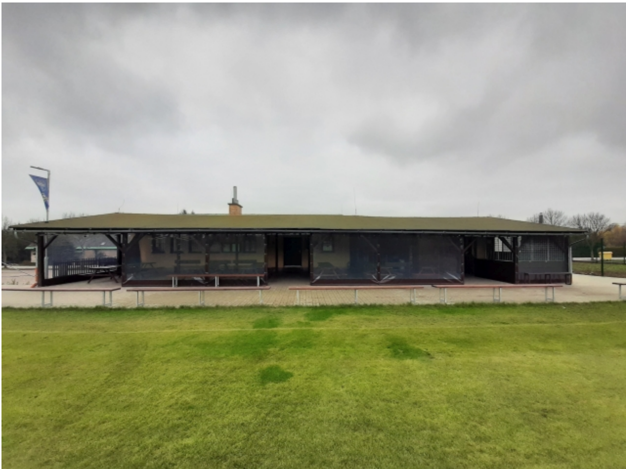
6. Kabiny TJ Sokol - přední strana