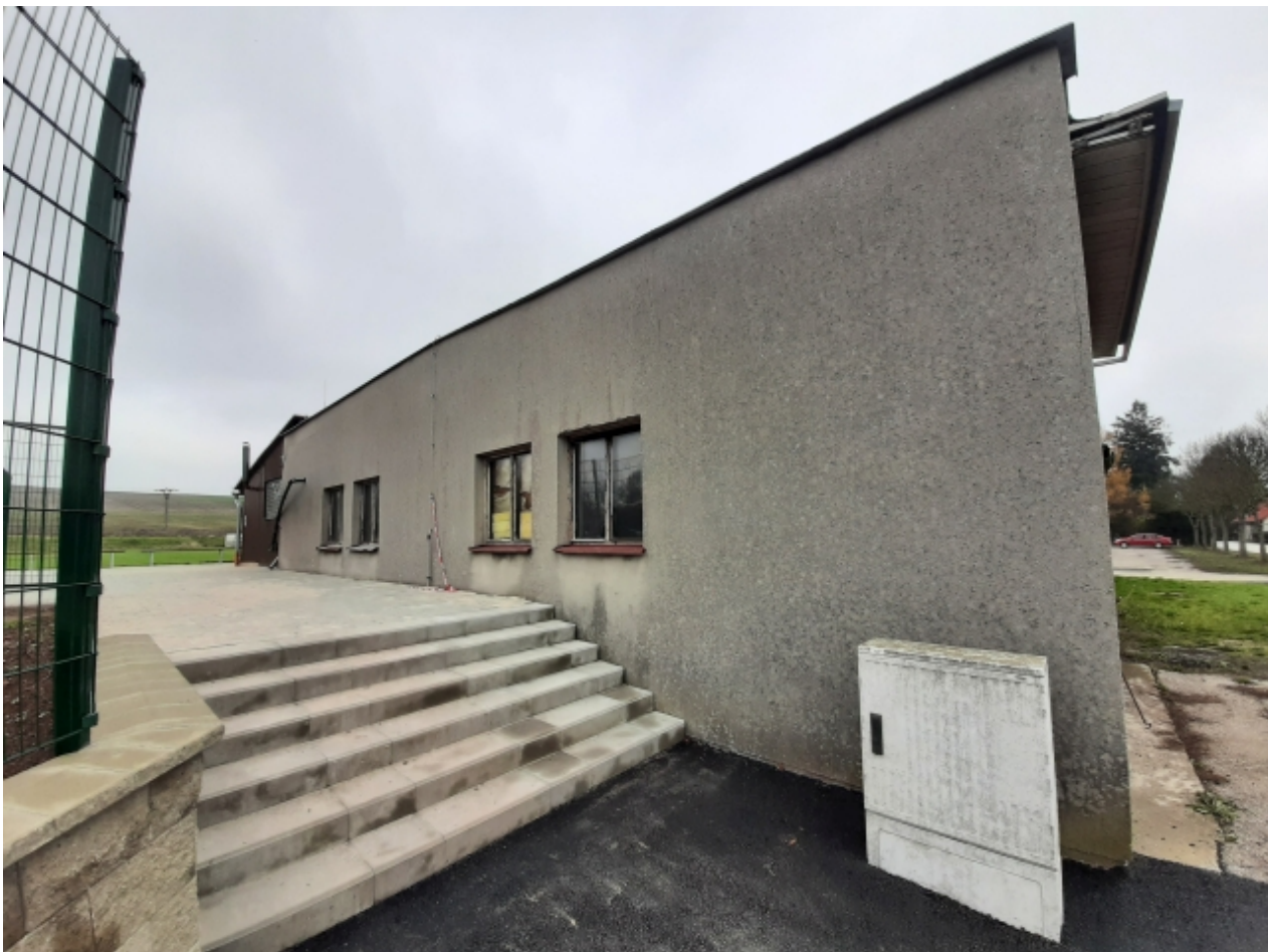
6. Kabiny TJ Sokol - pravá strana 2