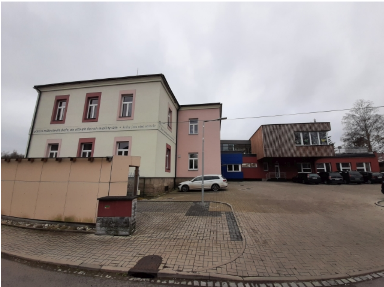
2. Základní a mateřská škola - pravá strana 2