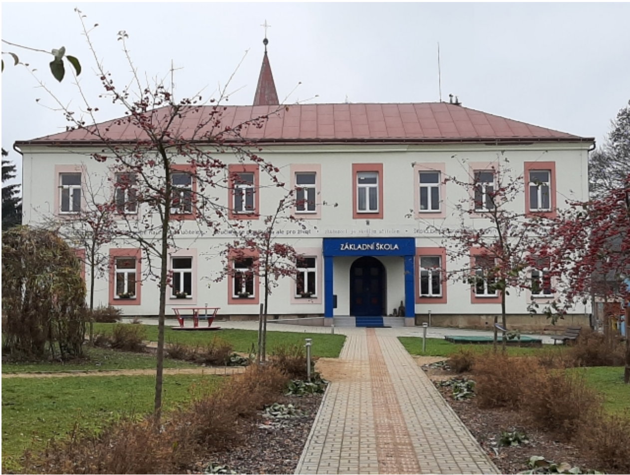
2. Základní a mateřská škola - přední strana 1