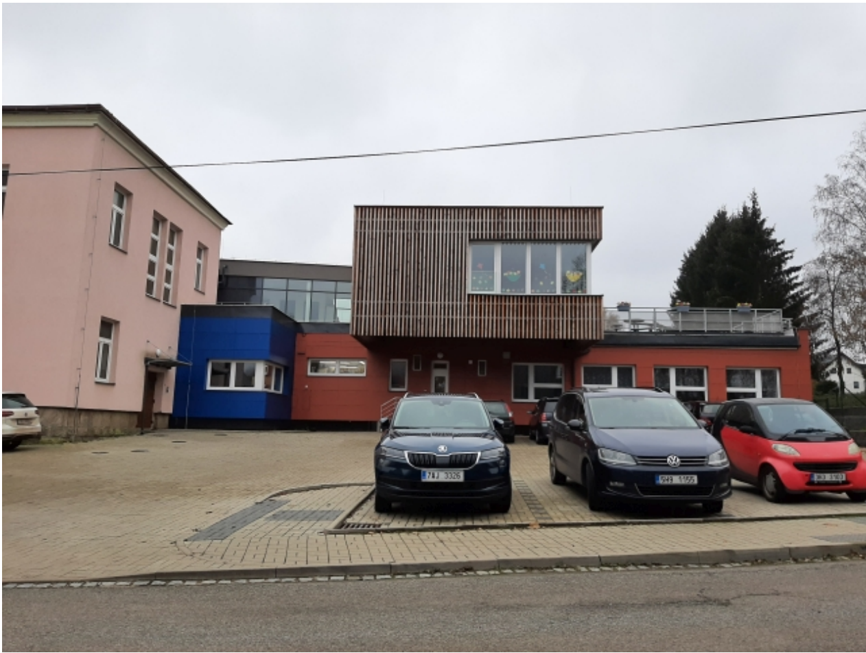
2. Základní a mateřská škola - pravá strana 1