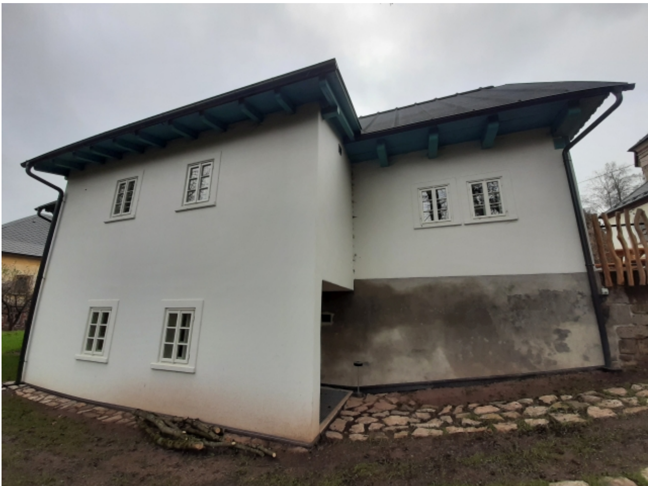
5. Muzeum lyžování v Dolní Branné - zadní strana 1