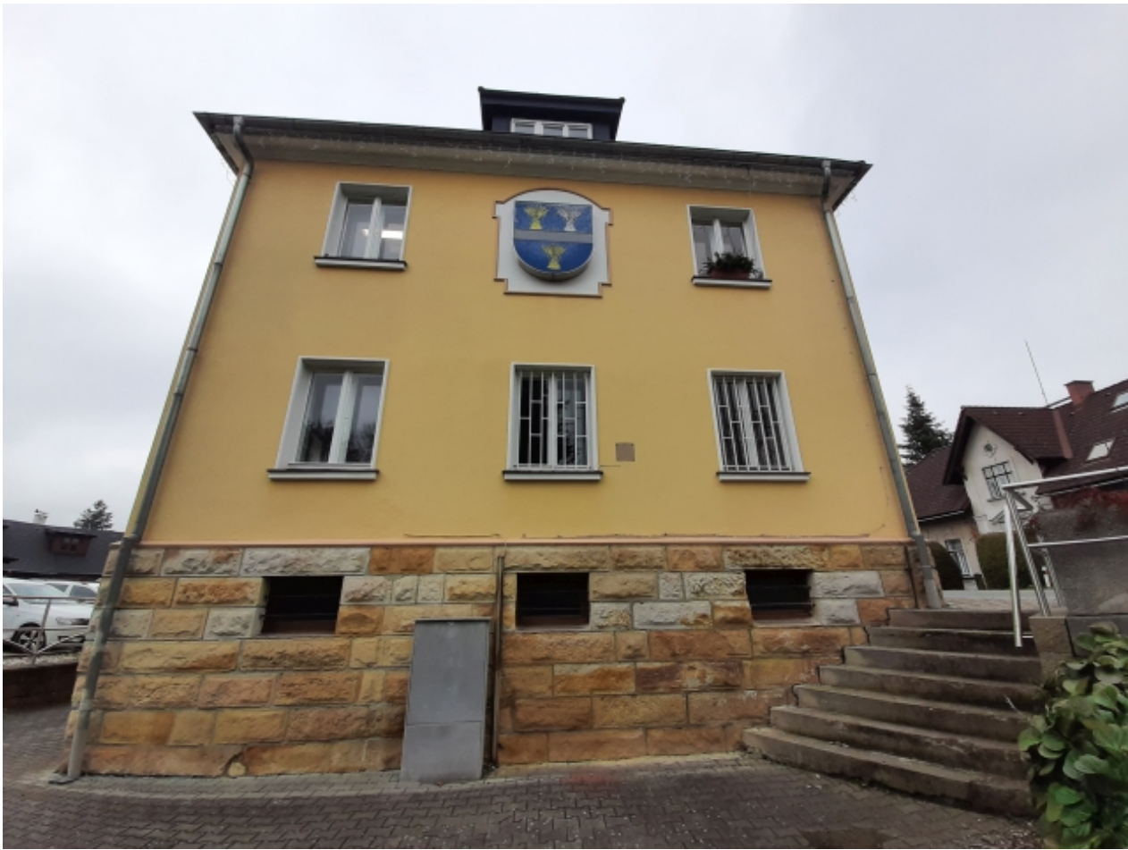
1. Obecní úřad - levá strana