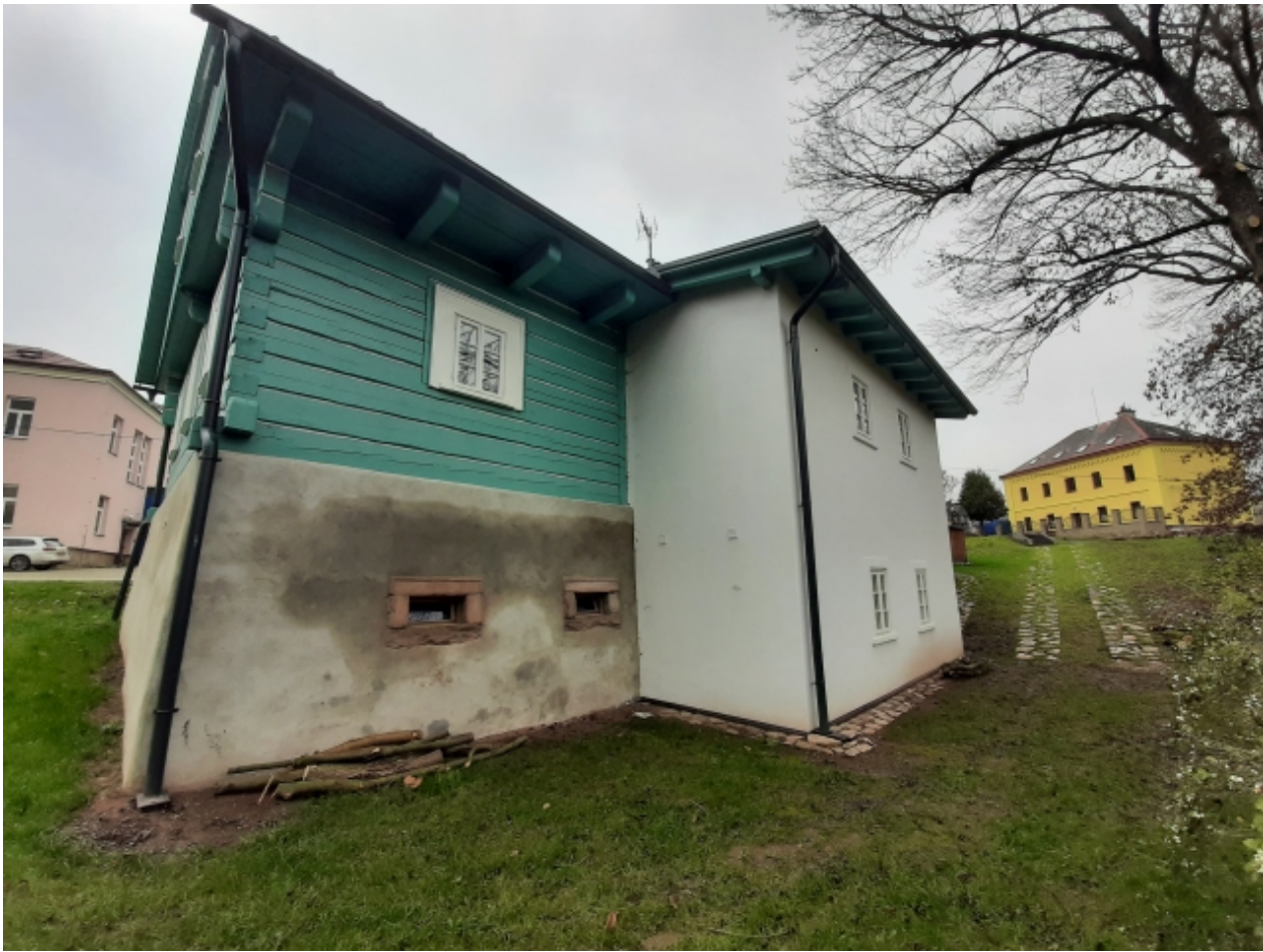
5. Muzeum lyžování v Dolní Branné - zadní strana 2