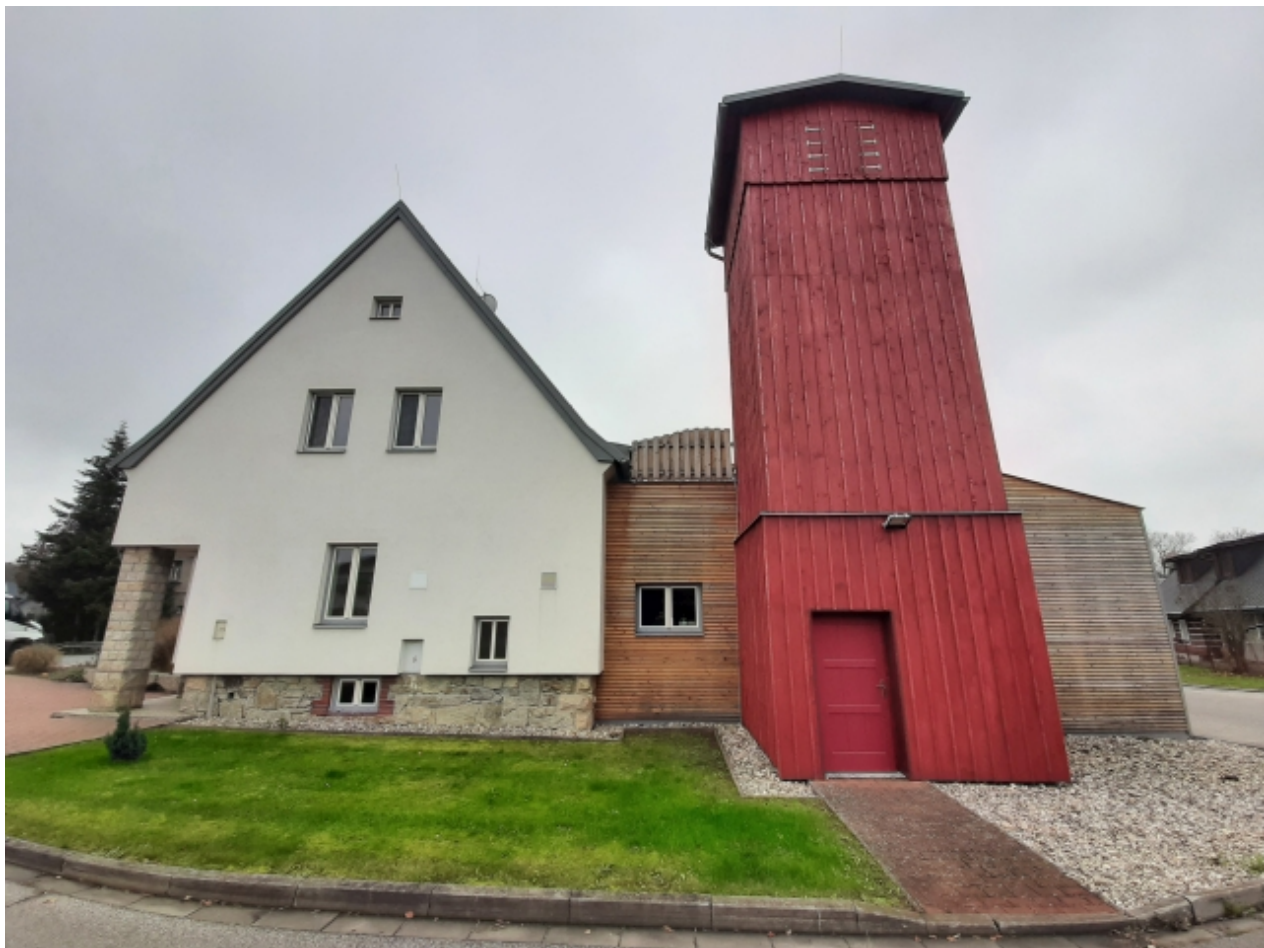
4. Požární zbrojnice - zadní strana