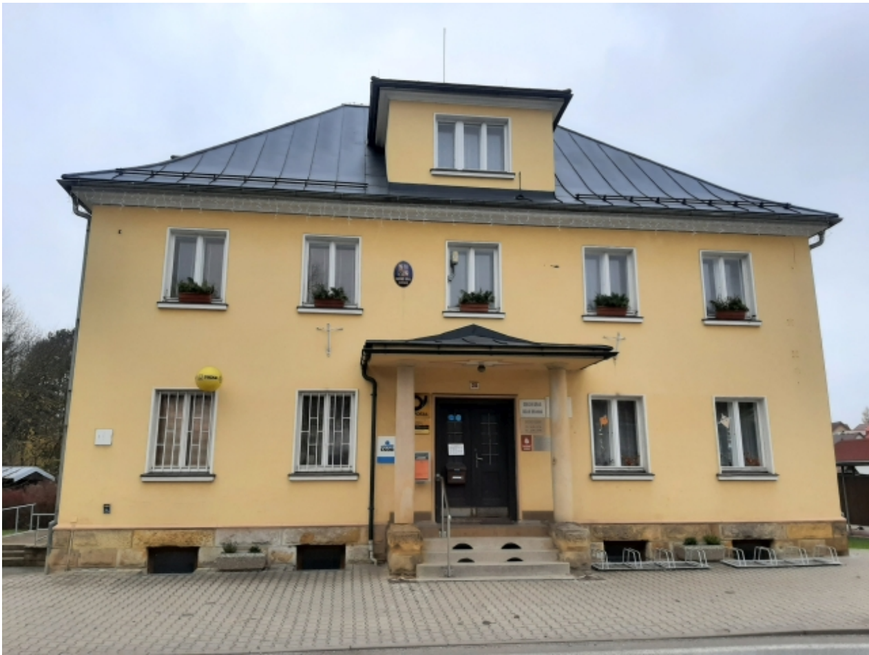
1. Obecní úřad - přední strana