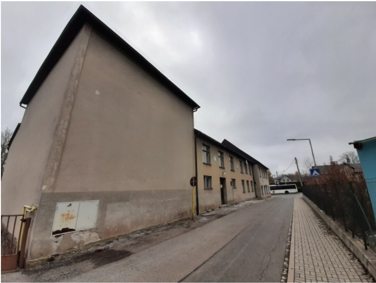
3. Kulturní dům - levá strana 2