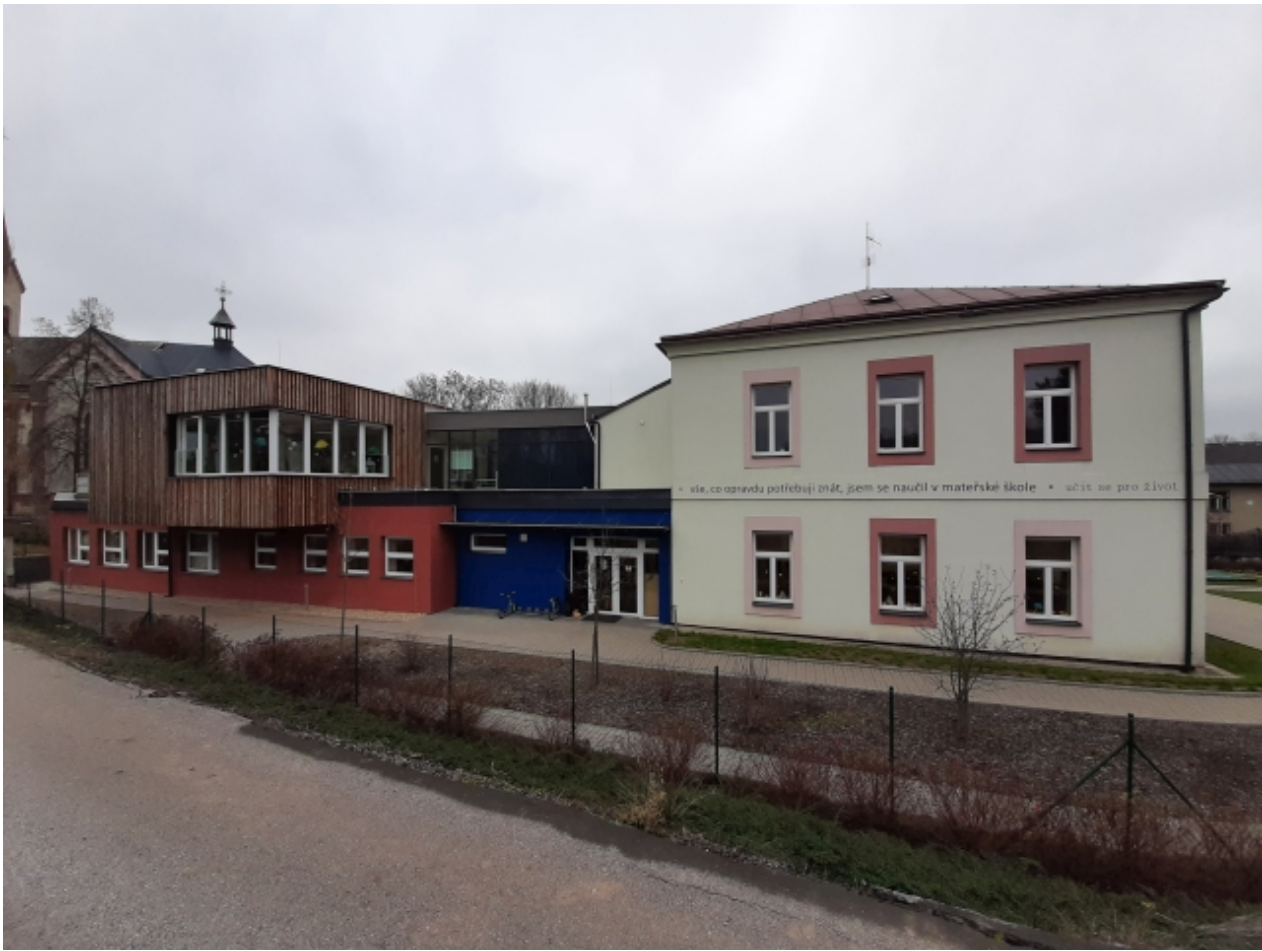
2. Základní a mateřská škola - levá strana 1