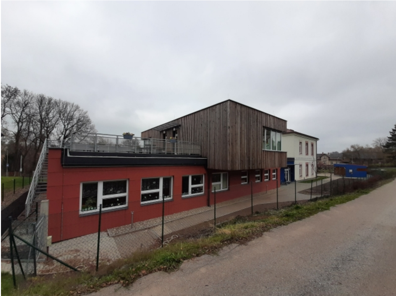
2. Základní a mateřská škola - levá strana 2