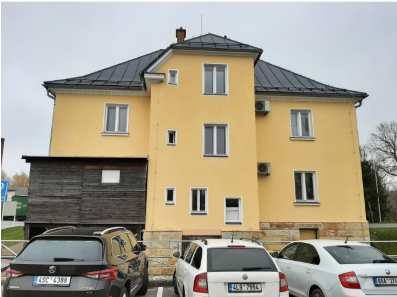
1. Obecní úřad - zadní strana