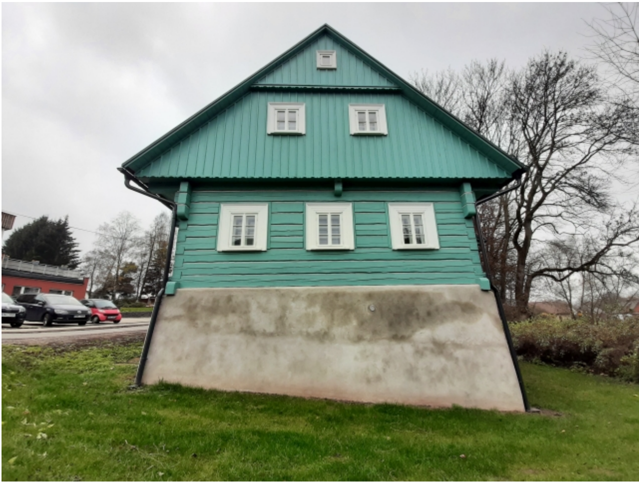
5. Muzeum lyžování v Dolní Branné - přední strana