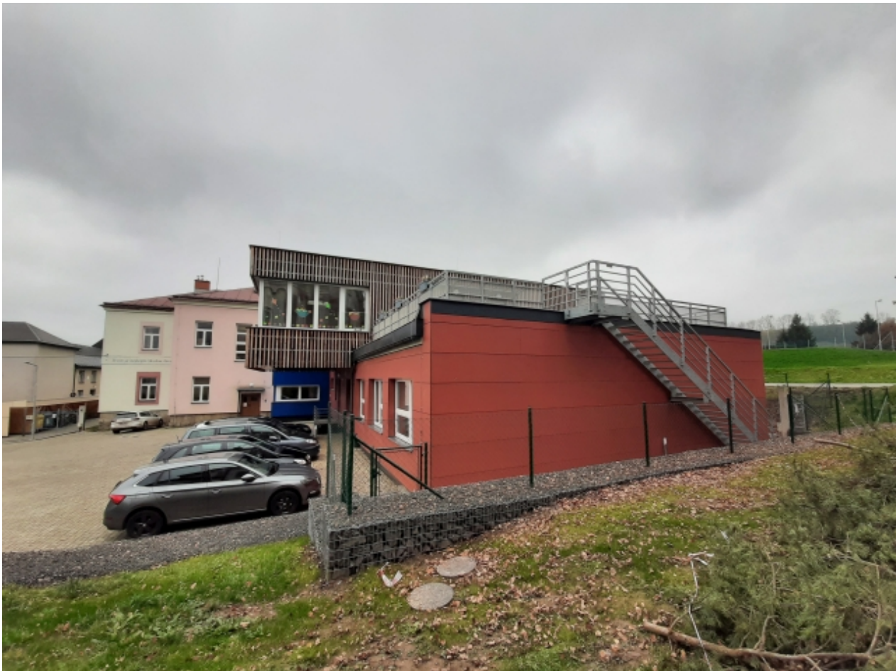
2. Základní a mateřská škola - zadní strana 2