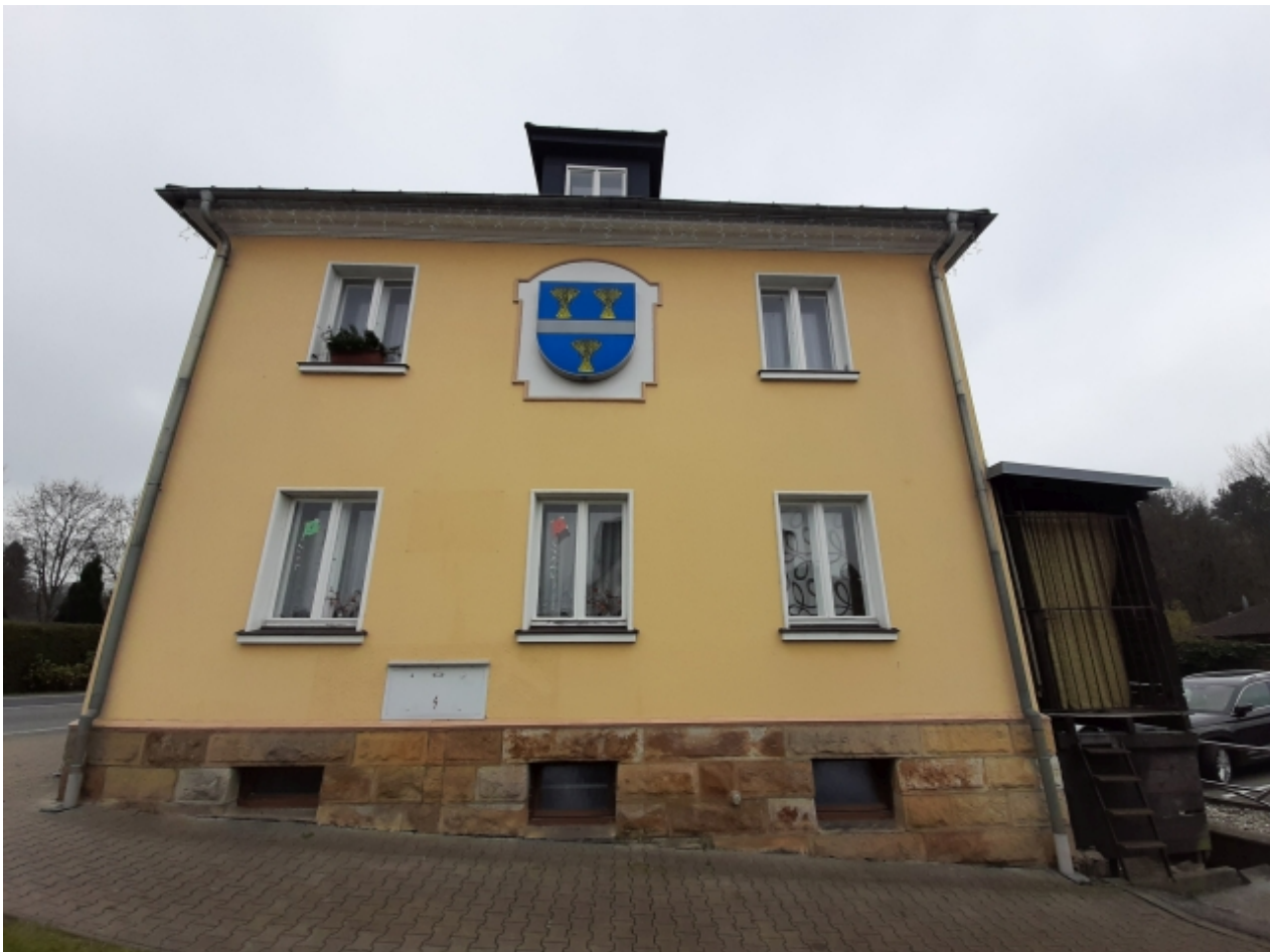
1. Obecní úřad - pravá strana