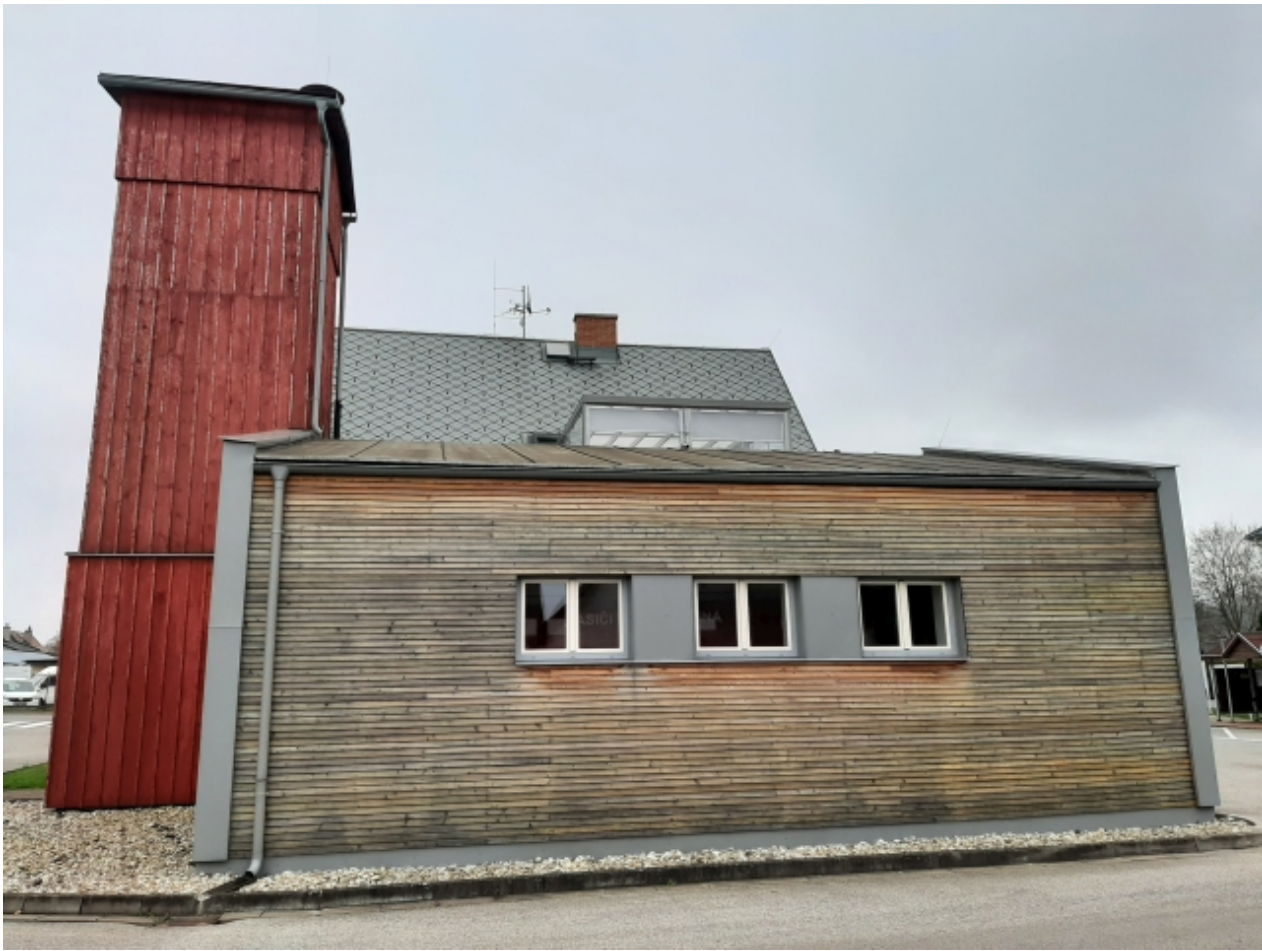
4. Požární zbrojnice - levá strana