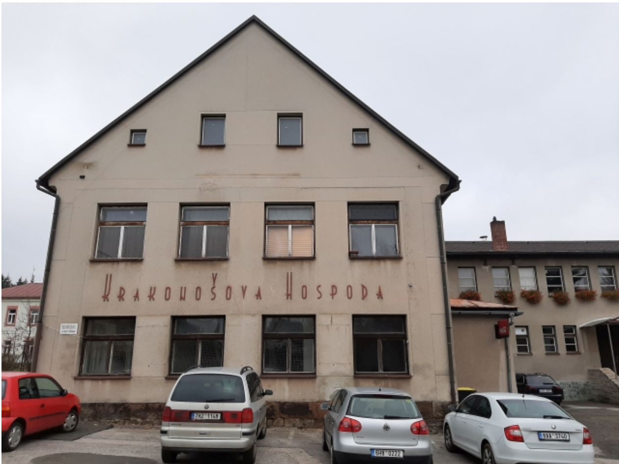
3. Kulturní dům - přední strana 2