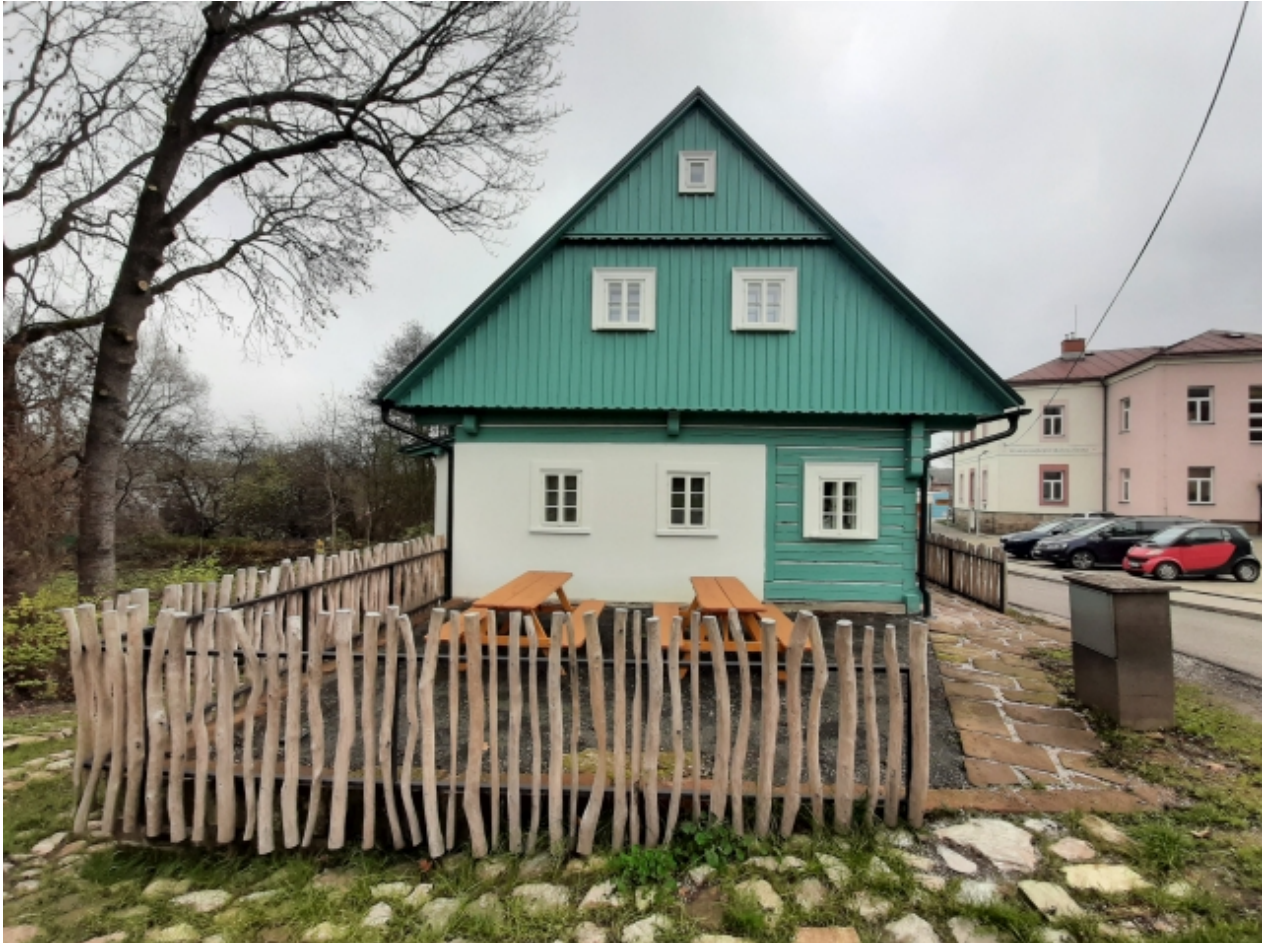
5. Muzeum lyžování v Dolní Branné - levá strana