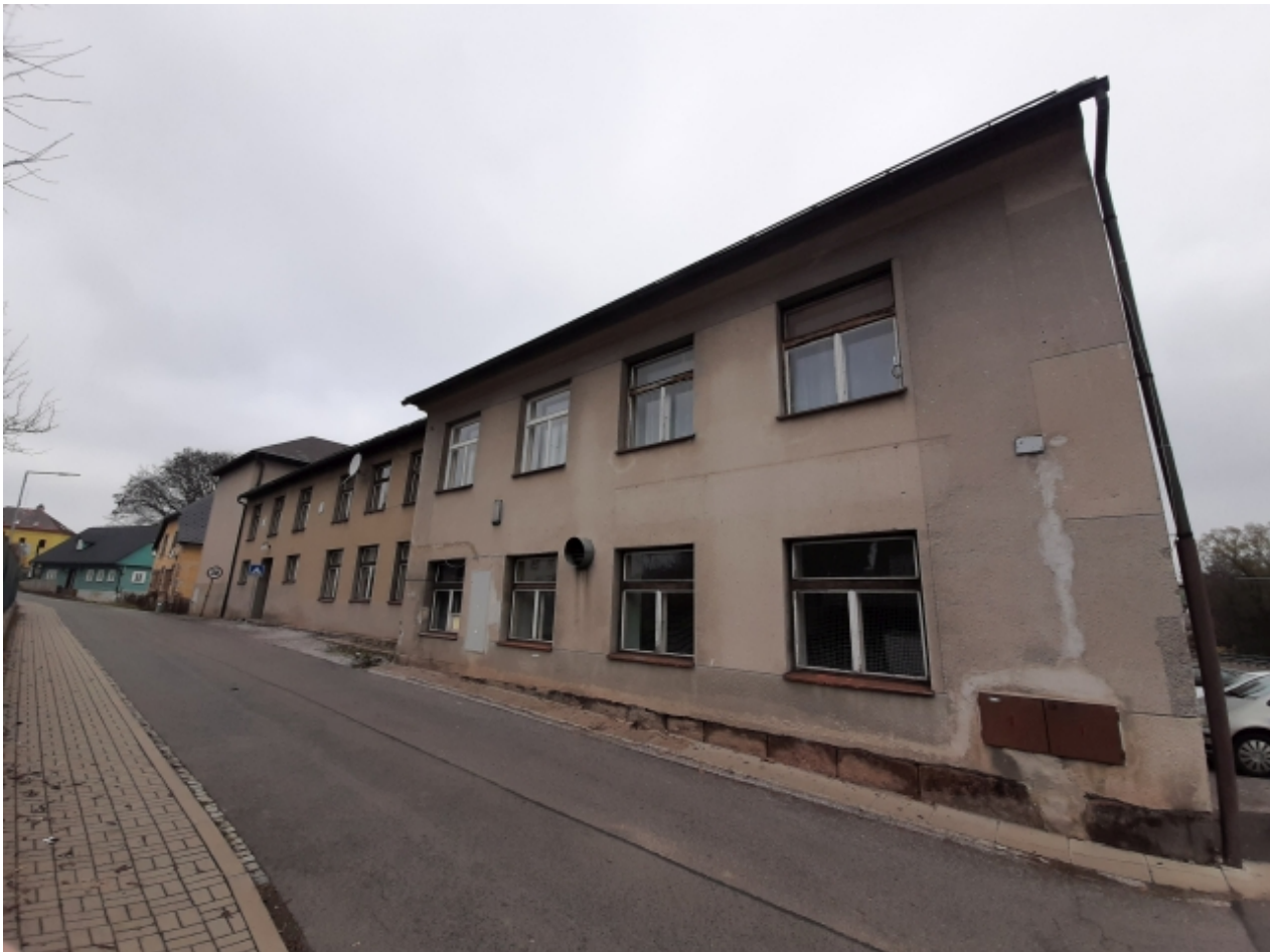
3. Kulturní dům - levá strana 1